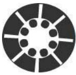
חבר לה"ב - לשכת ארגוני העצמאים והעסקים בישראל